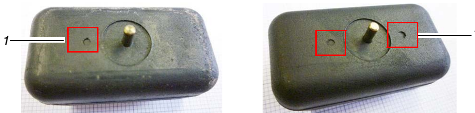
1 Z znacznikiem

Wymianie podlegają tylko pływaki bez znaczników . Pływaki ze znacznikiem (patrz Rys. poniżej) nie muszą być wymieniane .